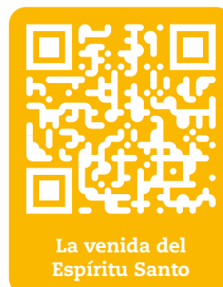
La venida del Espíritu Santo

“ Pentecostés ” era la fiesta judía celebrada 50 días después de la Pascua. Conmemoraba el día en el que Dios había dado su LEY a Moisés en el Monte Sinaí. “Pentecostés”, para los cristianos, recuerda y celebra la venida del Espíritu Santo a la Iglesia.