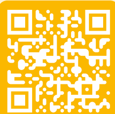
Vida y legado de Carlo Acutis, el joven influencer beatificado

En Youtube hay varios vídeos sobre Carlo Acutis. Quizás el más adecuado sea el titulado: “Vida y legado de Carlo Acutis el joven influencer beatificado” .